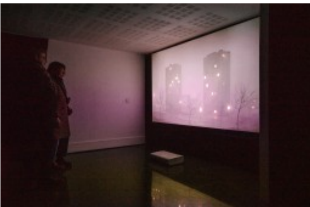
Vernissage A Room of Our Time . Photos Adrien Thibault